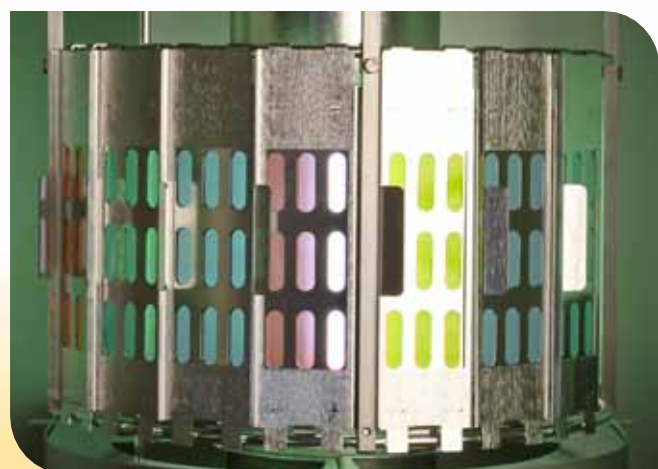
Rack porte-échantillons SEPAP MHE

Pour simuler les effets de l'eau, la SEPAP MHE+ est munie d'un système d'arrosage des échantillons.