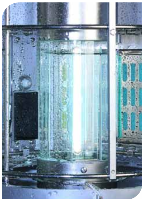
Contrôle BST sur le rack porte-échantillons, système intégré d'arrosage des échantillons

L'éclairement et la température au panneau noir (BST) sont contrôlés sur le rack porte-échantillons par un système de d'éclairage et de contrôle BST / XENOSENSIV sans fil. Cette configuration assure des conditions adéquates au niveau de l'échantillon.